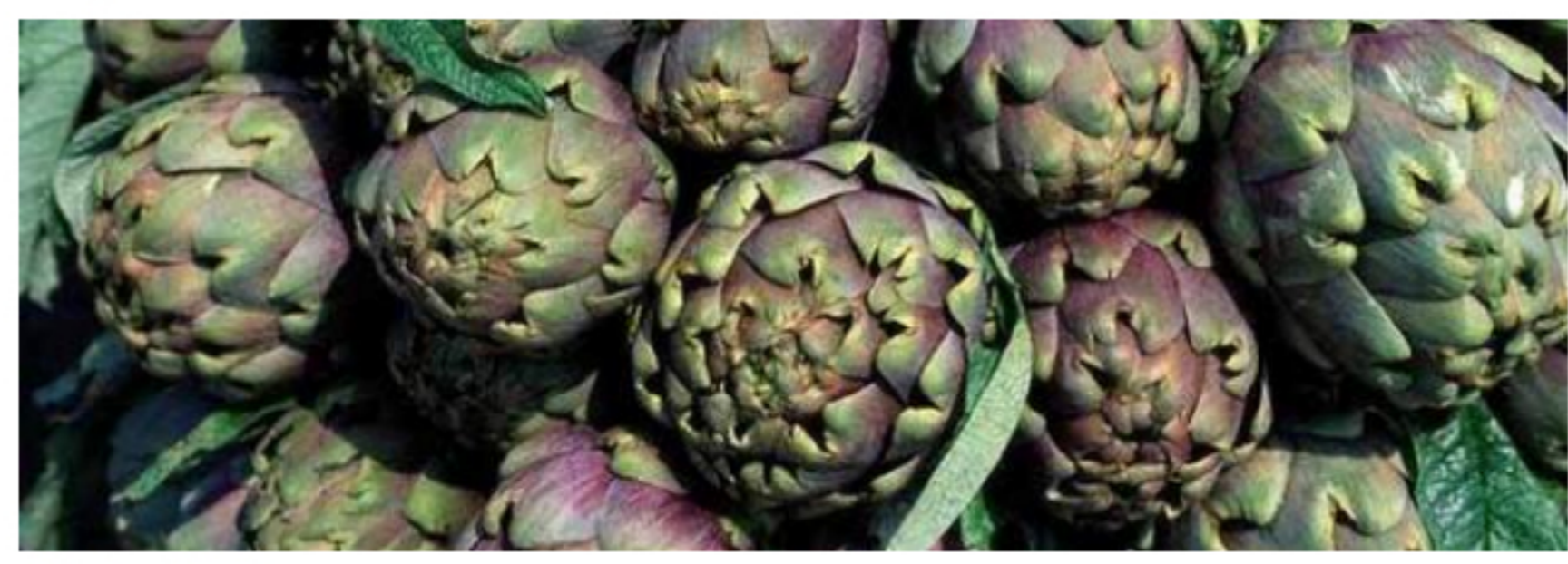
di Luciano Pignataro